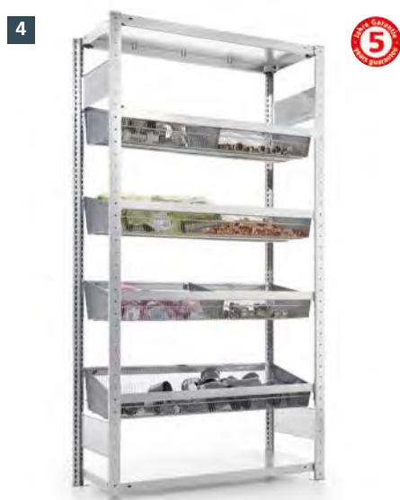
4 META CLIP Gitterkorbbregal Schwer (100 kg je Korb) · verzinkt