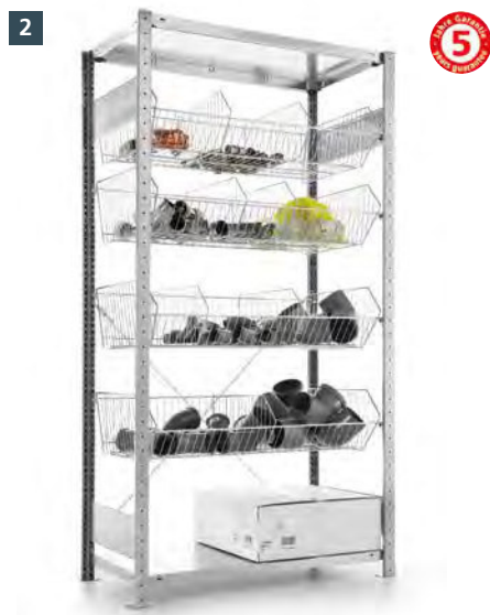
2 META CLIP Gitterkorbbregal Leicht (35 kg je Korb) · verzinkt