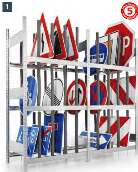
1 META CLIP Schilderregal · verzinkt · Fachlast 100 kg